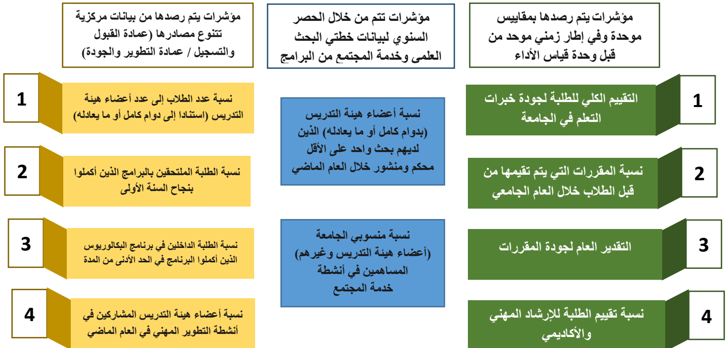
شكل (3): توزيع المؤشرات حسب طريقة الرصد وجمع البيانات